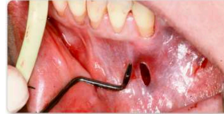
Schritt 5: Anheben der Papillen von mesial nach distal mit dem gekrümmten Ende des Instrumentes #4.