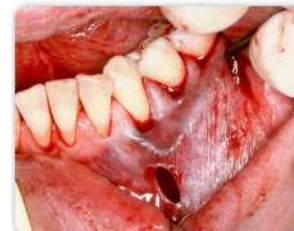
Schritt 6: Wiederholung von Schritt 4 und 5 von distal nach mesial mit gegenläufigem Instrument #3.