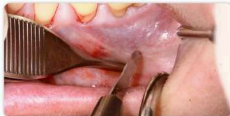
Schritt 3: Zusätzliche Inzision im Bereich des ersten Molaren 3 bis 4 mm unterhalb der Mukogingivalgrenze.