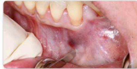
Schritt 1: Inzision in der Eckzahnregion 3 bis 4 mm unterhalb der Mukogingivalgrenze.