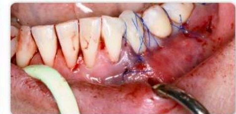
Schritt 8: Fixation des Lappens in koronaler Position mit vertikalen Umschlingungsnähten.