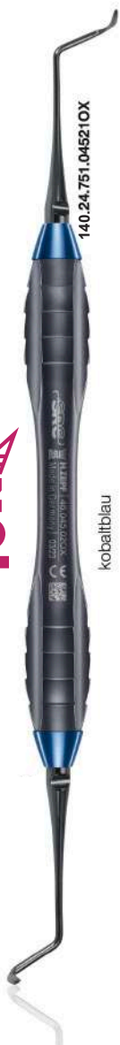
140.46.045.02OX rechts / kurz #2