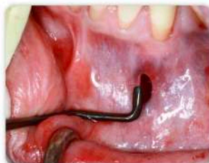
Schritt 4: Vertikale subperiostale Präparation von mesial nach distal bis zum Margo Gingivae mit dem geraden Arbeitsteil des abgewinkelten Instruments #4.