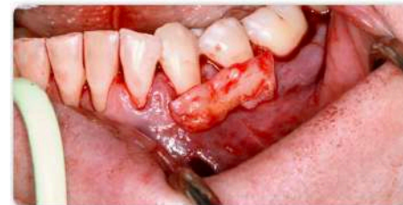
Schritt 7: Einbringen von autologem Bindegewebe oder Weichgewebe-Ersatzmaterialien.