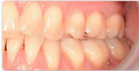
Bild 1: Klinische Ausgangslage mit generalisierten Rezessionen im Unterkiefer links

Anwendung: SRC Instrumente für die subperiostale Rezessionsdeckung nach Dr. Zeltner